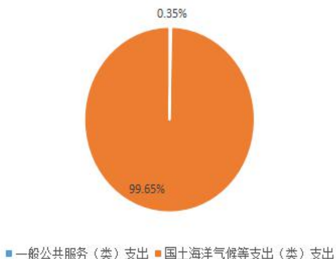
财政拨款支出决算结构（按功能分类）

2019 年度财政拨款支出 4523.16 万元，主要用于以下方面：一般公共服务（类）支出 15.95 万元，占 0.35%，为 2019 年小升初和不动产登记接口开发费用；国土海洋气候等支出（类）支出 4507.21 万元，占 99.65%，其中基本支出 3282.95 万元，项目支出 1224.26 万元。